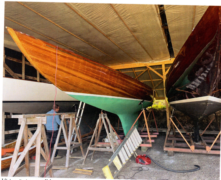
Vision är i gott sällskap på Hummelmora varv.