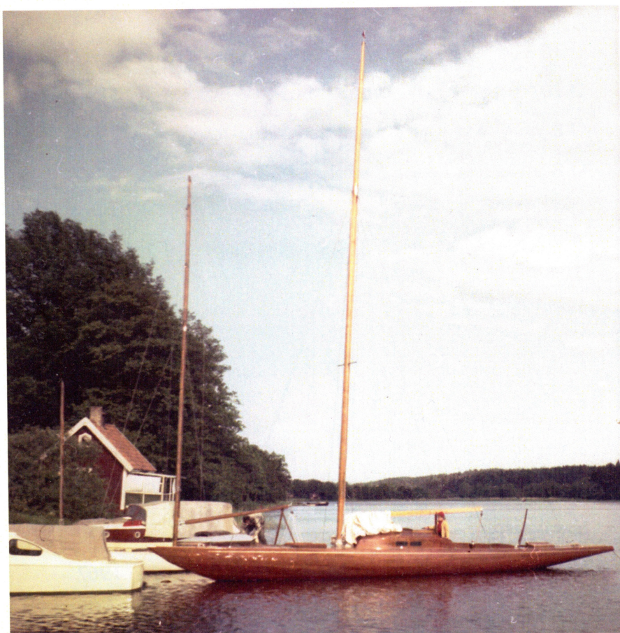
Vision kappseglade mot 30 S 192 Tintomara, en Becker-konstruktion byggd 1955.